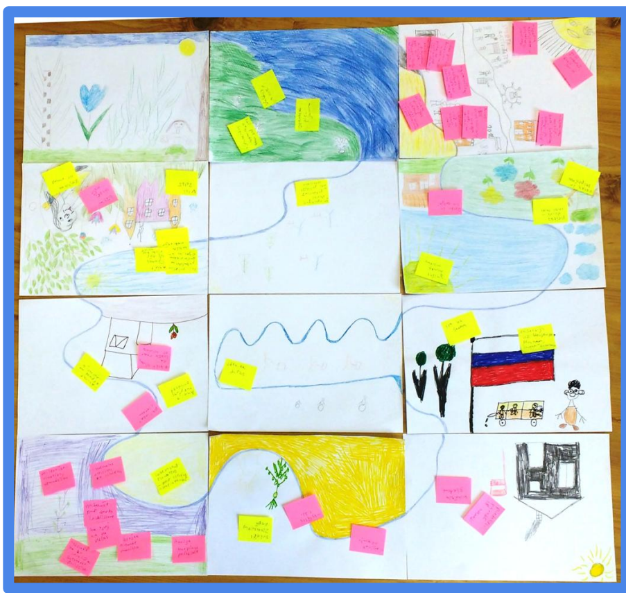
Rezultāts: Konsultatīvās Padomes stratēģija (01.09.2017. – 01.09.2018.)